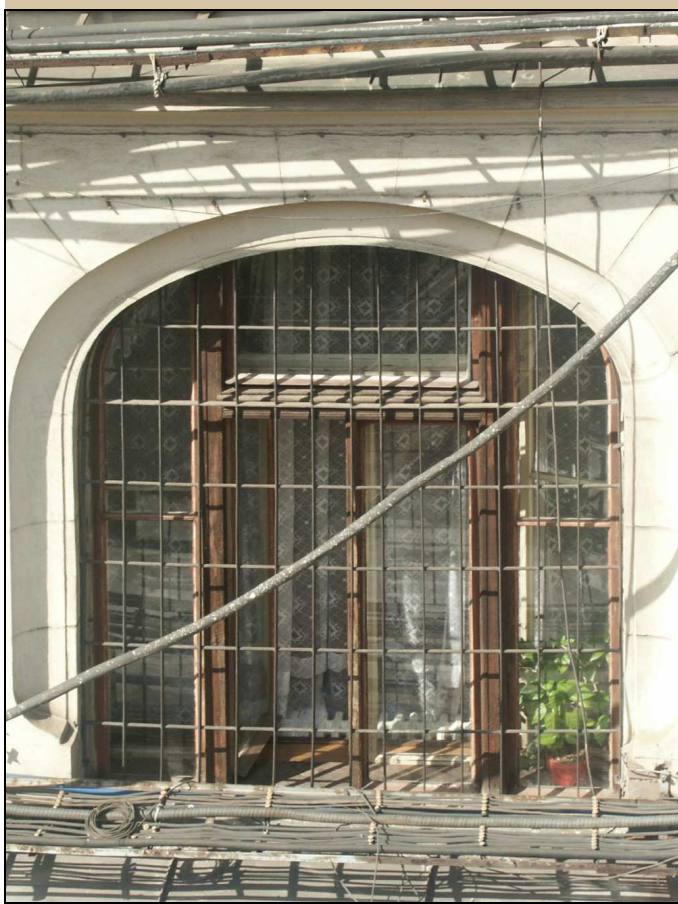
okno – celkový pohled z exteriéru