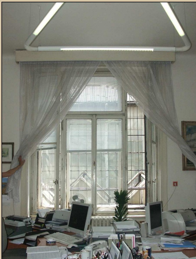
okno – celkový pohled z interiéru