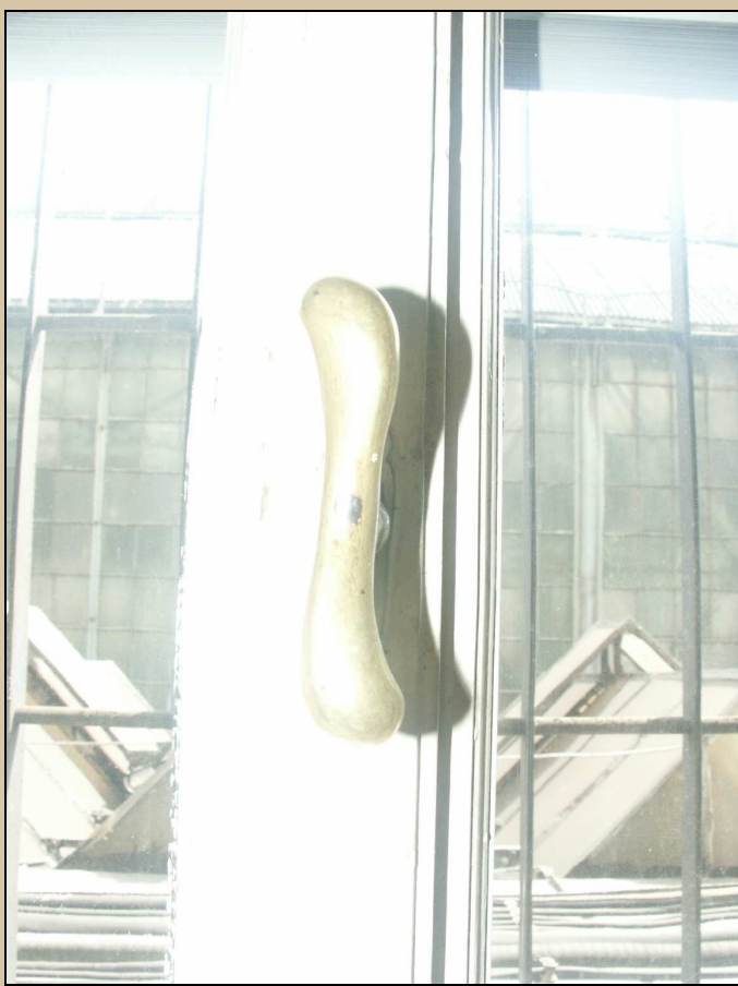
okenní klička střední části okna