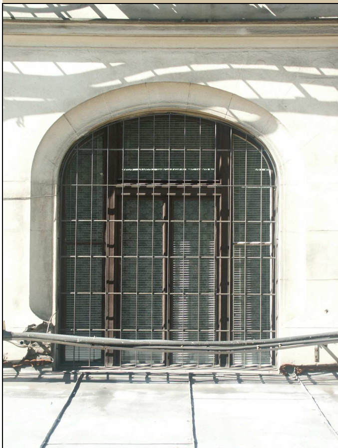
okno – celkový pohled z exteriéru

NÁVRH: repasovat, ponechat na původním místě, zachovat kličky, závěsy, zasklení (je-li historické), obnovit původní barevnost oken, bude-li zjištěna, nebo provést nátěr dle stávajícího stavu, s výjimkou kliček natřít i kování – viz stávající stav odstranit nepůvodní mříže Obnovit původní barevnost podle průzkumu barevnosti oken. Z interiéru obnovit bílý nátěr, z exteriéru obnovit povrchovou úpravu, shodnou jako u již rekonstruované části C. Viz technologický postup TP/118.